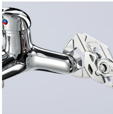
Práce s chromovanými armaturami bez poškození povrchu